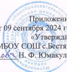
График проведения школьного этапа Всероссийской олимпиады школьников в 2024-2025 учебном году